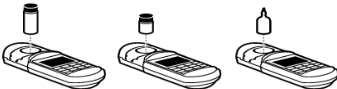
图 5 将样品放入样品池盒中

用不起毛的布或纸巾擦拭样品池,然后将样品池插入样品池盒中,并使菱形标记朝着键盘。