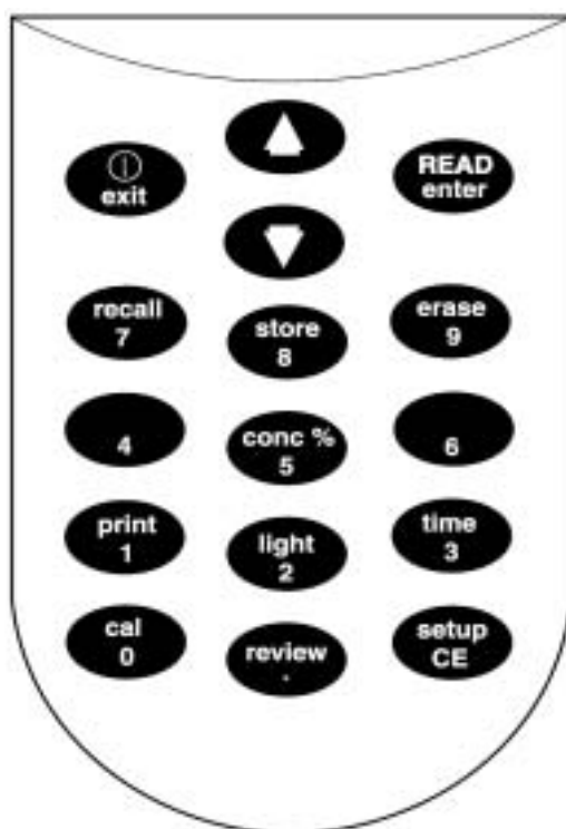
表 1 按键及功能