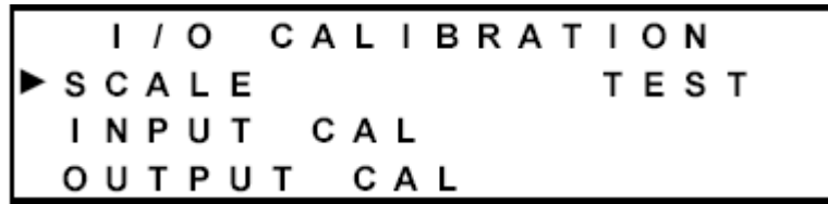
图 13 输入/输出 (I/O) 校准

图 13 显示的是输入/输出 (I/O) 校准界面。光标指明的是您希望选择的选项。使用向上箭头 (▲) 键和向下箭头 (▼) 键在一栏内移动光标。使用向左箭头 (◀) 键和向右箭头 (▶) 键在栏间移动光标。使用 ENTER (回车) 键来选择选项。要退出本界面并返回到设置界面，按 ESC (退出) 键。