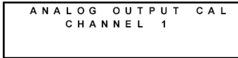
图 16 选择校准通道

图 16 显示的是一旦从输入/输出 (I/O) 校准界面选择了输出校准 (OUTPUT CAL) 后第一次显示的界面。这个界面选择要校准的输出通道。要获得校准输出的更多信息，参阅本手册中的维护部分。