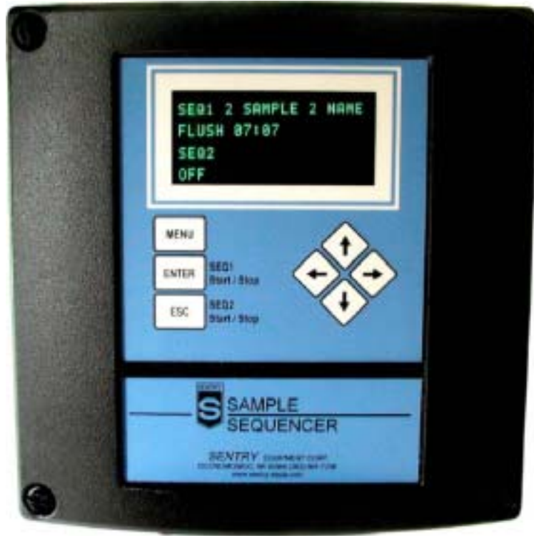
图 4 样品序列发生器前面板