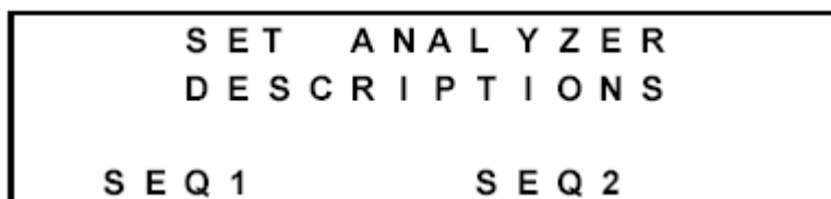
图 23 设置测定仪描述界面

测定仪描述的出厂默认值是 SEQ1 (序列生成器 1) 和 SEQ2 (序列生成器 2)。这些描述可以使用设置测定仪描述 (Set Analyzer Descriptions) 界面来更改这些描述。参阅附录 C 来获得关于可用字符的指南。