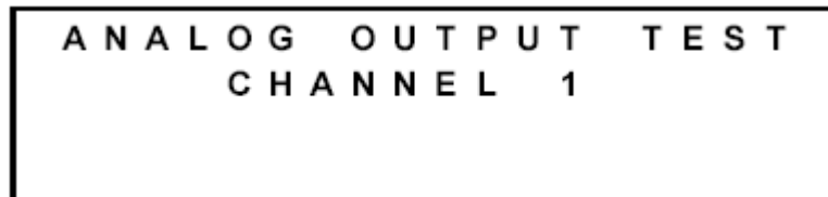
图 18 选择要测试的通道

图 18 显示的是一旦从输入/输出 (I/O) 校准界面选择了测试 (TEST) 后第一次显示的界面。这个界面选择要测试的跟踪和保持输出通道。要更改通道要退出并返回输入/输出 (I/O) 校准界面，按 ESC (退出) 键。